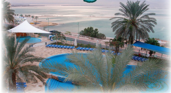
在日出時，站在死海旁的渡假酒店遠望前方的死海，相當迷人！