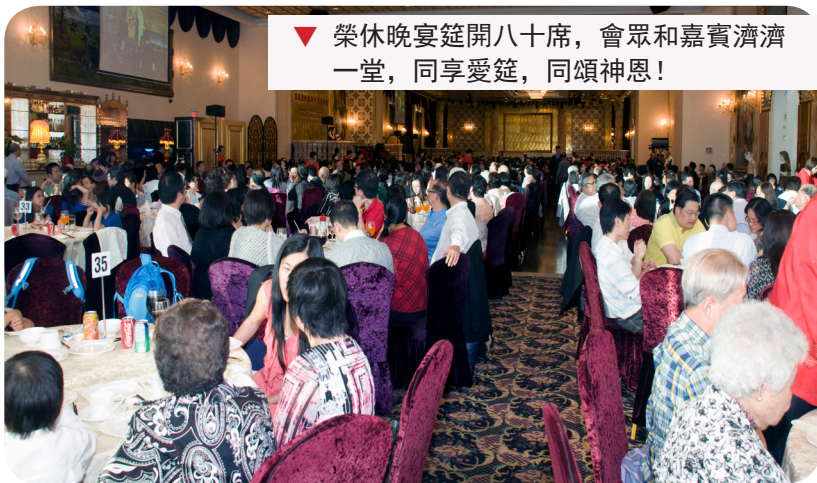
▼ 榮休晚宴筵開八十席，會眾和嘉賓濟濟一堂，同享受筵，同頌神恩！