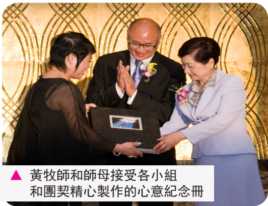
▲ 黃牧師和師母接受各小組和團契精心製作的心意紀念冊

黃牧師一向以身作則，愛護會眾，努力傳福音，帶領教會向前。神也恩待我們，今天會眾有不同語言、年齡和背景；聚會人數超越千人，濟濟一堂，教會實在很蒙福。牧師決定在教會主任牧師崗位退下來，我們一方面要向他衷心表達敬愛之意，感謝他夫婦過去無私地為教會獻上自己，致力關愛弟兄姊妹，樂意付出最大的力量和犧牲領導教會，我們應為他感謝神。另一方面，我眾當為他前路祈求，讓神給他新方向，繼續侍主。我們更當同心見證主恩，思想擴展福音、植堂、差傳事工，以努力傳揚主福音為己任，又要為尋覓繼任主任牧師之事，尋求神的旨意，放下己見，同心以禱告傳道之事為念，此乃教會之福，也是我們在主裡學習彼此接納，繼續蒙福之途徑。 ■